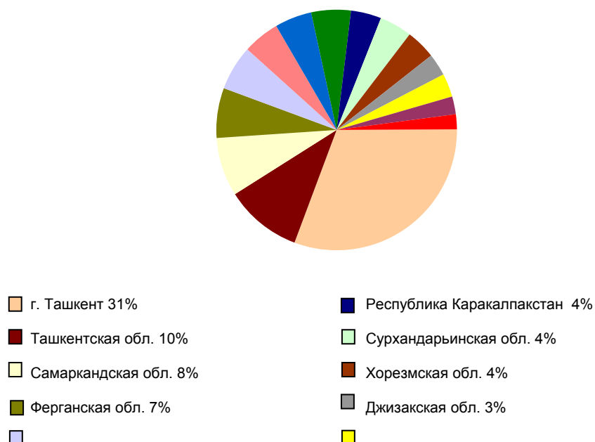
Распределение сделок по регионам в 2008 году (по стоимости переданного в лизинг имущества)

Из 29 лизинговых компаний, только 5 совершают лизинговые сделки практически во всех регионах Республики. К ним относятся Узсельхозмашлизинг, Узавтосаноат лизинг, Пахта лизинг, Курилиш лизинг и Alfa Lizing. Филиальная сеть банков позволяет существенно разнообразить региональную картину распределения сделок, однако по итогам 2008 года из 20 банков только 3 охватили практически всю республику: Асака банк, Ипотека банк и Микрокредитбанк.